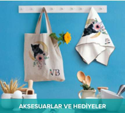
AKSESUARLAR VE HEDİYELER